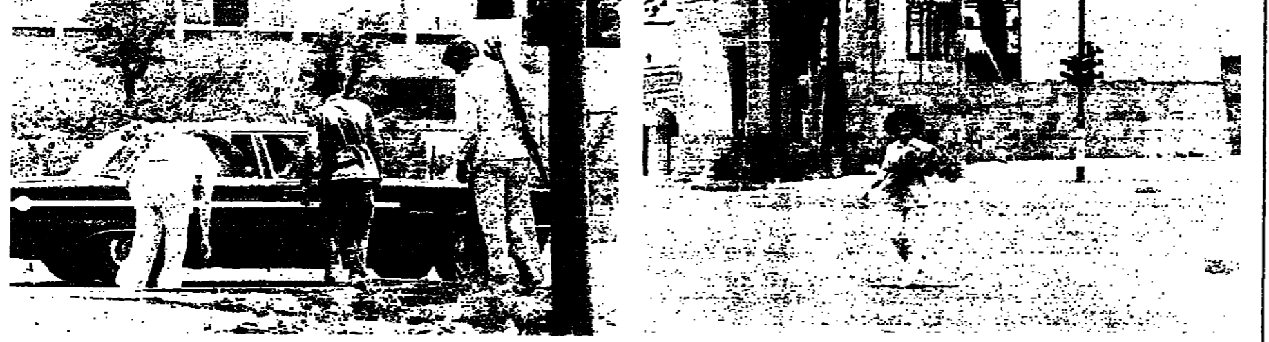
صباح امس ، وسبق كان اطلاق الرصاص لا يزال مستمرا في شارع اسد الاسد وعين الرمانة ، وقد تم الاستعداد عند استئناف القتال

المخالفات الخطية الإيجابية ، واخت تفرغ الزهور على رجال الامن والسيارات المقلدة المارة في الشارع. وفي الصورة الى اليمين ، يسود السيدة تحمل باقة كبيرة من الزهور وسط الشارع ، وفي الصورة الثانية ، قدم زعيروا في ركاب سيارة وبجانيتها اثنان من رجال الامن